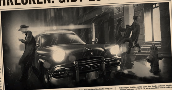
BÜRGERWEHR REGIERT DIE STRASSEN

Alle Bürger werden dazu aufgefordert, wachsam zu bleiben. Die Polizei hat eine besondere Telefonleitung für Hinweise eingerichtet, über die Bürger jegliches verdächtige Verhalten oder seltsame Vorfälle sofort melden sollen. Angesichts des großflächigen Schadens an