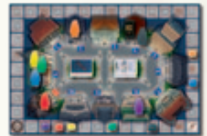
Nach dem Zug von Adam

Anschließend verzichten alle Spieler. Es findet keine Wertung statt. Adam gibt jetzt den Würfel an seinen linken Mitspieler. Bernd ist am Zug.