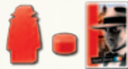
Roter Agent mit Wertungsstein und Karte

Zu jedem Agenten gehören in der gleichen Farbe ein Wertungsstein und eine Agentenkarte.