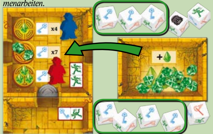
Beispiel: Ani (rot) und Frank (blau) haben gemeinsam 7 Schlüssel erwürfelt und entscheiden sich 2 magische Steine zu aktivieren. Sie legen 2 Steine von der Steinablage in die Kammer.

Anmerkung: Um 1 Stein zu aktivieren, könnt ihr zusammen arbeiten, um 2 oder 3 Steine zu aktivieren, müsst ihr zusammenarbeiten.