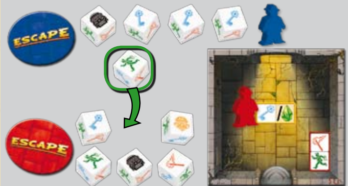
Beispiel: Frank ist in Sicherheit und gibt einen Würfel an Ani (rot), die ihn ab sofort würfeln kann.

Seid ihr entflohen, befindet ihr euch in Sicherheit und dürft einen Würfel an einen beliebigen anderen Abenteurer im Tempel weitergeben . Dieser darf ihn ab sofort verwenden.