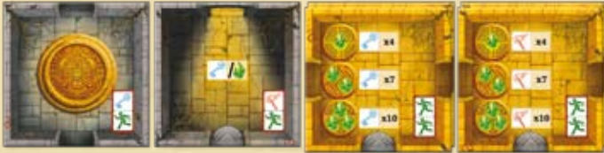
Startkammer Ausgang 2x Steinkammer (Schlüssel) 2x Steinkammer (Fackel)