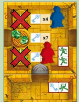
Beispiel: Weil schon einmal 2 magische Steine in dieser Kammer aktiviert wurden, kann kein Spieler hier weitere Steine aktivieren.

Habt ihr in einer Kammer mindestens einen Stein aktiviert, darf kein Abenteurer bis zum Ende des Spiels in dieser Kammer weitere Steine aktivieren.