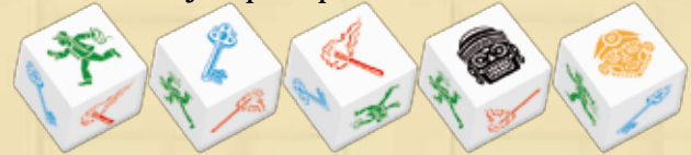
Abenteurer Schlüssel Fackel Schwarze Maske Goldene Maske