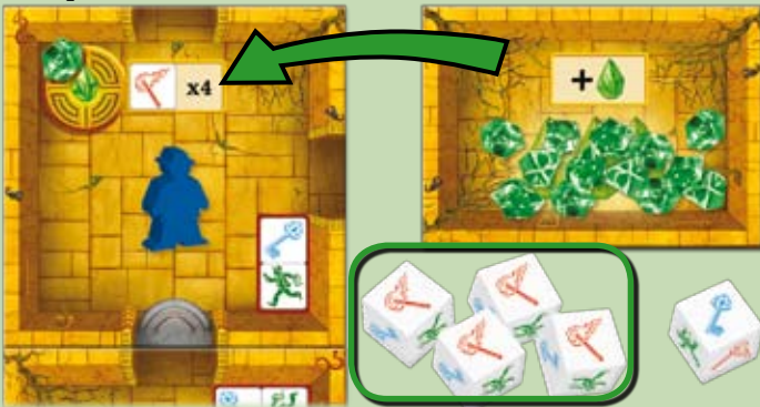
Beispiel: Frank hat 4 Fackeln erwürfelt und aktiviert den magischen Stein in der Kammer. Er legt einen Stein von der Steinablage in die Kammer.

Befindet ihr euch in einer Kammer, müsst ihr die entsprechende Anzahl an solchen Fackel- oder Schlüsselsymbolen erwürfeln, um entsprechend viele magische Steine zu aktivieren. Um anzuzeigen, dass ein Stein aktiviert wurde, legt ihr ihn von der Steinablage auf die entsprechende Kammer.