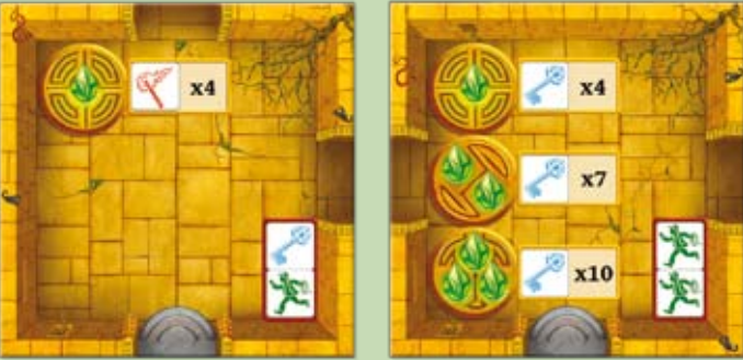
Kammer mit 1 Steinsymbol Kammer mit 1, 2 und 3 Steinsymbolen

Es gibt zwei Arten von Kammern, in denen ihr magische Steine aktivieren könnt: